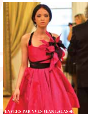
ENVERS