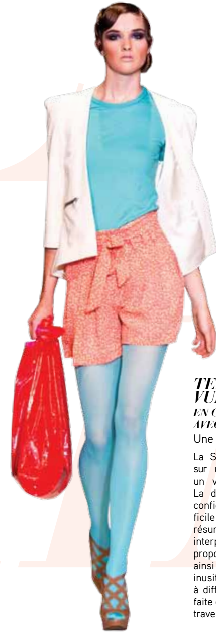
TENDANCES SMM19 VUES PAR YSO

Il flotte toujours comme une atmosphère de fête aux défilés de Barilà, et celui de cette édition ne faisait pas exception à la règle. Montréal s'est faite Hawaï le temps de la présentation d'une collection à la sensualité colorée. Micros, les robes et les shorts, mignonnes les chemisettes, sympathiques les t-shirts aux imprimés vintages dessinés par Danny Lawless. Les combis shorts ont été présentés en plusieurs déclinaisons, dont celle bustier au balconnet irrésistible.