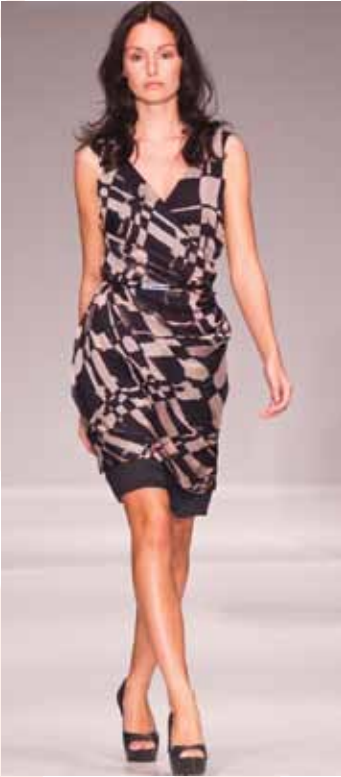
COLLECTION IRIS SETLAKWE Tailleurs à l'honneur

Si la griffe de la québécoise Iris Setlakwe existe depuis 2001, elle n'avait pas encore foulé les passerelles de la Semaine de mode. Ce fut chose faite lors de cette 19 e édition, et nous avons ainsi pu découvrir des vestes d'inspiration sahariennes, des shorts, des tailleurs-pantalons et des robes mêlant adroitement confort et élégance. Les teintes neutres de vieux-rose, sable et kaki se retrouvaient parfois fondues dans un léger tie-and-dye printanier.