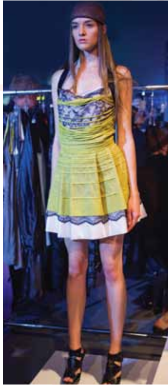
CLUC COUTURE Nomades sédentaires

Lors de la précédente édition de la SMM, l'équipe derrière Soïa & Kyo avait innové en présentant la ligne pour hommes Kyo, et récidive cette saison avec des pièces masculines printemps-été. Un défilé mixte, donc, d'inspiration militaire pour elle, mais décontractée pour lui. Vestes et trenchs sans manches, tissus au fini lustré, la collection détonnait avec ce que les habitués des présentations de la marque connaissent. Voilà ce qu'on appelle savoir se réinventer.